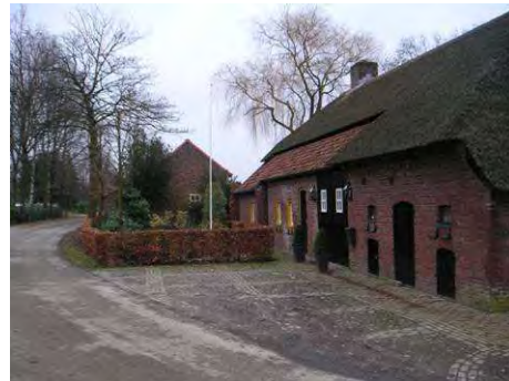
Karakteristieke boerderijen Dijkerakkerweg