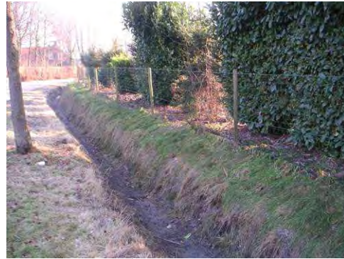
De afwatering rondom de Dijkerakker