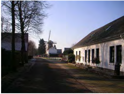
Keenterstraat met zicht op de St. Annamolen