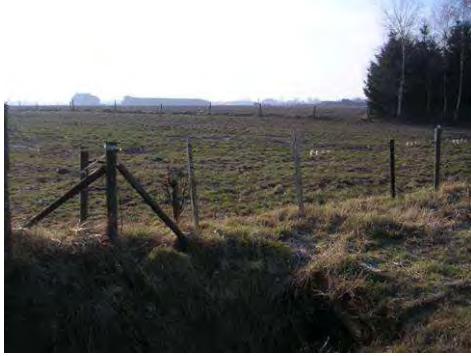
De enigszins bolle Dijkerakker