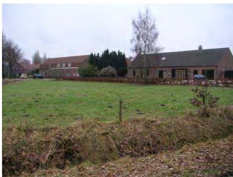
Boerderijen nabij dries Dijkerstraat