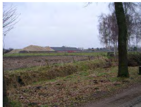
Grote loods met buitenopslag Klakstaartweg