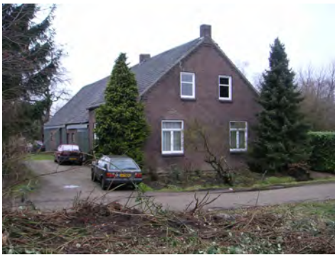
Bebouwing aan Keentersteeg, westzijde