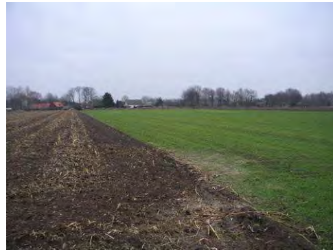
Zicht vanuit het midden van de Dijkerakker