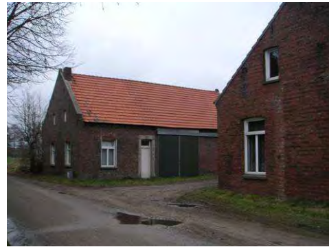
Bebouwing aan de Keentersteeg, oostzijde