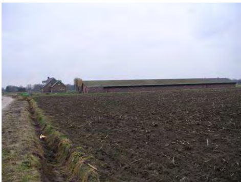
Recente bedrijfsbebouwing midden op akker