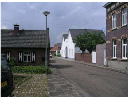
Kronstraat met poortgebouw brouwerij