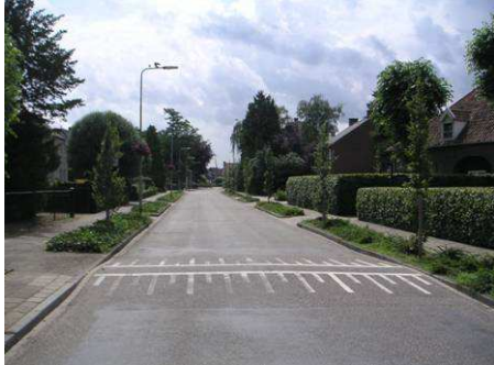
Zicht Wilhelminastraat richting St. Jansmolen