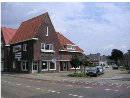
Hoek Kronstraat - Julianastraat