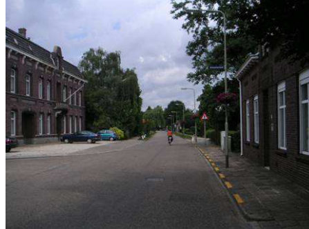
Vanaf Kronstraat richting Wilhelminastraat