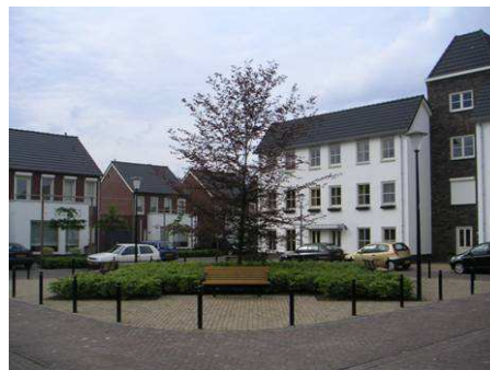
Nieuwbouw flankeert de oude mouttoren aan de Brouwerij Maeshof