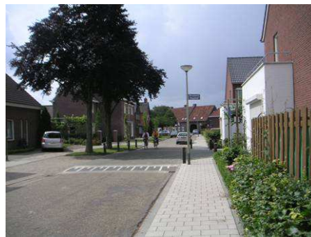
Zichtlijn door Kronstraat naar Julianastraat 31