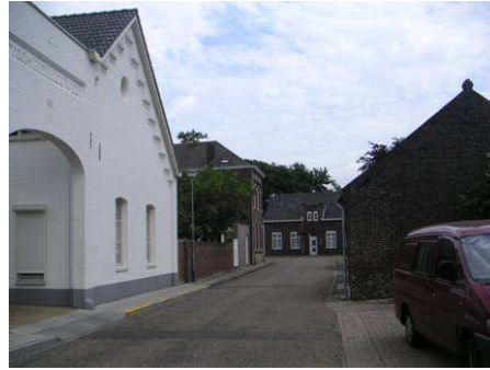
Kronstraat richting Wilhelminastraat